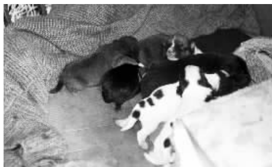
挤在妈妈怀里的6条小狗崽十分可爱

派出所民警好心收留一条流浪狗,没想到几天之后它居然生下了6条小狗。冒出这么多狗狗,派出所就养不过来了,民警希望有好心市民前来领养。