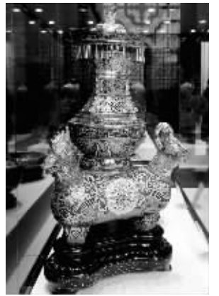
吉祥三宝尊