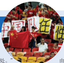
碰谁都无所谓,中国队太任性

面对这样的中国队输了,那作为东道主就太丢人了。”而在国足与乌兹别克斯坦的比赛结束后,澳大利亚广播公司用《中国掀翻乌兹别克斯坦挺进八强》为标题进行了报道,他们称赞中国队踢得极具侵略性,且一改之前给世人留下的“中国功夫”的坏印象。除此之外,技术动作展现得非常干净。他们将是阻挡东道主夺冠的拦路虎。