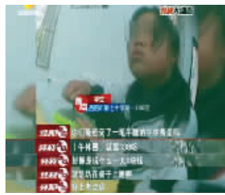
学生向记者介绍情况 视频截图