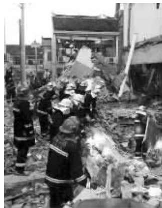
爆炸现场

记者了解到,发生爆炸的楼房,底楼店面当夜无人在店内,二楼居住的是一对三十多岁的夫妻,三楼的居民当晚恰巧不在家中,爆炸致使住在二楼的这对夫妻被压,两人还有一个在读书的孩子,由于