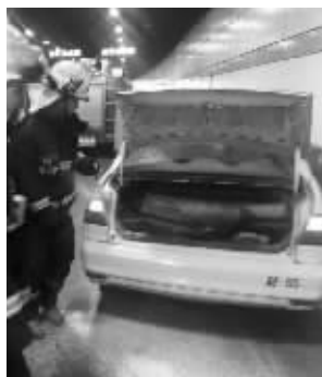
自燃的出租车后备箱里有一个气罐

快报讯(记者 李宇龙)昨天中午11点40分左右,在龙蟠中路通济门隧道内,一辆由北向南行驶的出租车后侧底盘突然冒出火苗。“看到后面冒烟我就赶紧把车靠边停下了。”的哥吴师傅说,他赶紧从车上拿出灭火器灭火。路过的出租车司机也停车帮忙灭火,在众人帮助下,火被扑灭。