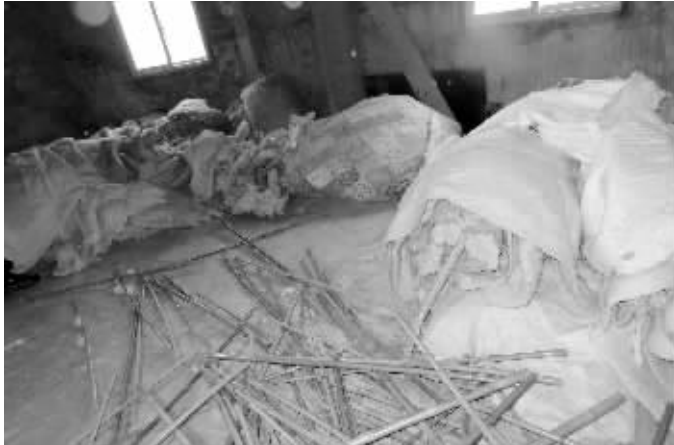
作坊内有大堆做原料的破棉絮

介绍,一条价格25元,重量在三四斤;还有一堆重一些,是论斤卖的,8元一斤,一条被子四五十元。