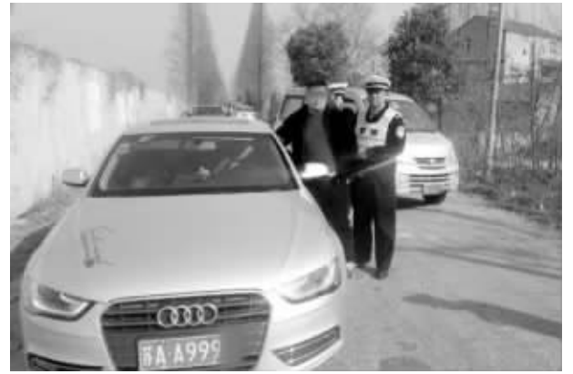
警方对套牌车进行查处

快报讯(通讯员 江公宣 记者 陶维洲)捡到一个有“999”数字的车牌,一名奥迪车主觉得很霸气,就装到自己的车上,自己的车牌弃之不用。不过,交警很快发现了他套牌的事,对其做出罚款5000元记12分的处罚。