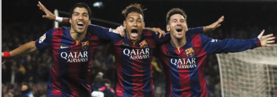
巴萨恐怖的“MSN”组合——梅西(右)、苏亚雷斯(左)、内马尔