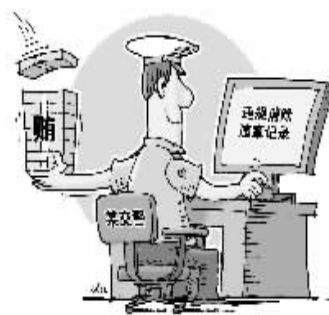
漫画：此“销”彼“涨” 徐俊作