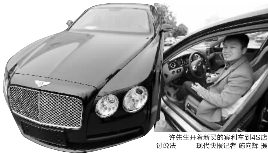
许先生开着新买的宾利车到4S店讨说法

买了辆近300万的高档车,开回老家后办了酒席庆祝一番,不料在客人面前,车子却发动不起来;不仅如此,车子还锁不上,夜里还要安排人看守……这是来自溧阳的许先生的遭遇。1月9日,他在南京软件大道17号一家销售公司买了辆宾利飞驰,才几天工夫发现车子故障不少,既丢面子又伤心。