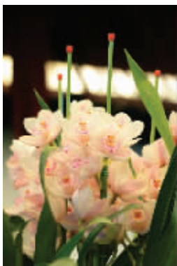
大花蕙兰花朵密集