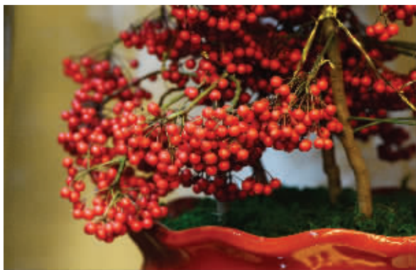
富貴子好看又好养