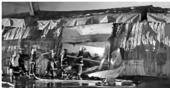
消防队员在现场救火

现代快报记者了解到,在接到市民报警后,南京市公安、消防等部门领导立即赶到现场组织指挥,