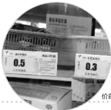
药店里的廉价药已越来越少

药品成分一样,但容易造成血压峰谷现象,所以缓控制剂要比普通制剂贵。但是,如果是同种化学名,又是同种剂型,也都是国产的,那么药价高低,就是商业行为了,不一定贵的就好。