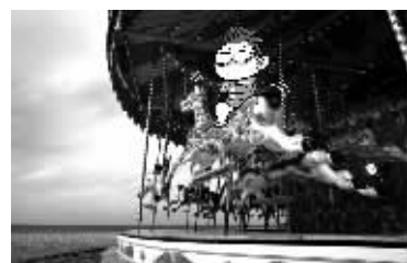
寂寞第八级:一个人逛游乐园