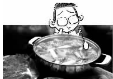
寂寞第五级:一个人吃火锅