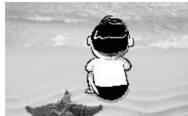
寂寞第七级:一个人看海