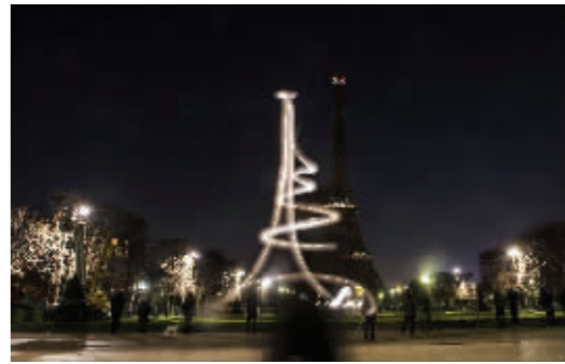
1月8日20点整,巴黎埃菲尔铁塔灭灯5分钟悼念遇害者。这是熄灯后用电光笔绘的埃菲尔铁塔轮廓