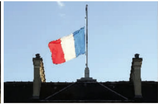
1月8日,法国巴黎爱丽舍宫降半旗,哀悼恐怖袭击遇难者