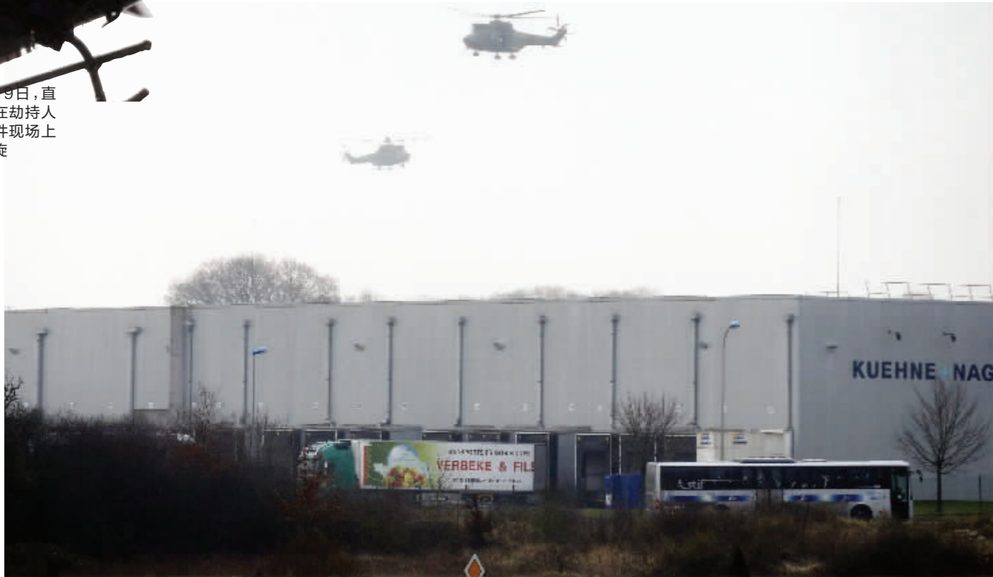
1月9日,在法国达马尔坦昂戈埃勒,两架直升机在劫持人质事件现场上空盘旋