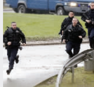
1月9日,警方人员抵达劫持人质事件现场