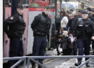
1月9日,警察协助当地儿童乘坐大巴撤离 本版图片均据新华社