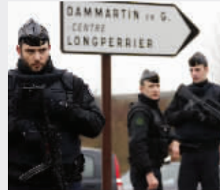
1月9日,警方人员在劫持人质事件现场附近检查车辆