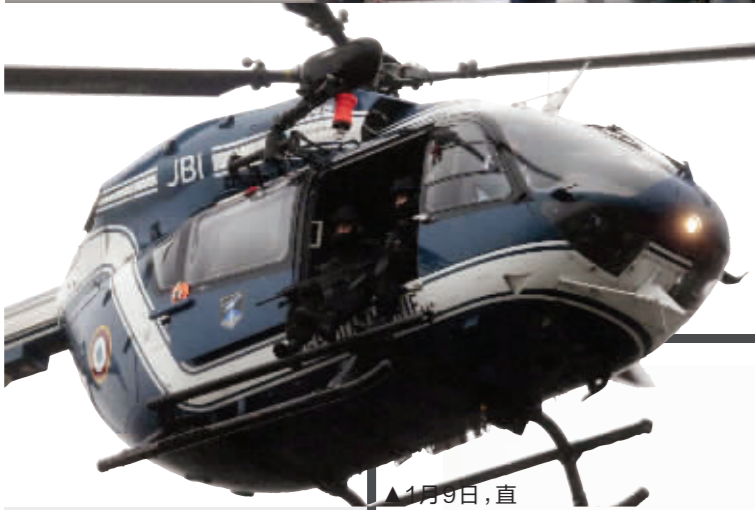
1月9日,直升机在劫持人质事件现场上空盘旋

法国安全部门消息人士9日说,袭击《沙尔利周刊》巴黎总部的两名嫌疑人(34岁的赛义德·库阿希和32岁的谢里夫·库阿希)当天在巴黎戴高乐国际机场附近一家印刷企业内劫持至少一名人质,与警方对峙。