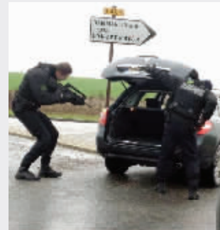
1月9日,法国警察对过往车辆进行检查