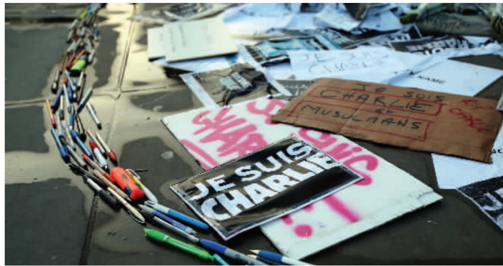
1月8日,在英国伦敦特拉法加广场,伦敦民众摆放“我是沙尔利”的标语和笔来悼念恐怖袭击死难者