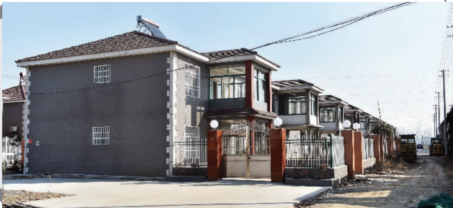
镇江丹徒区辛丰镇于南村已经建好的安置房