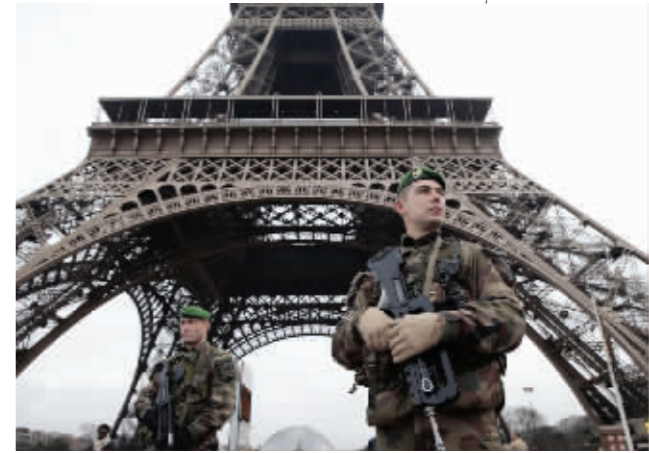
法国军人在埃菲尔铁塔下执勤,恐怖袭击血案发生后,法国当局立即加强了反恐措施

为抓捕7日在巴黎发动血腥袭击的三名嫌疑人,法国不仅出动上千名警察和宪兵,还特别派出一支神秘的反恐特种部队——“黑豹突击队”,他们将发挥特殊作用。