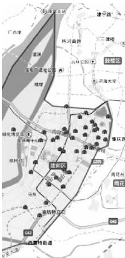
网页上注明了建邺区幼儿园分布,点击还能看资料

此外,记者还了解到,一般幼儿园招生在3-5月份,没有硬性规定不能提前,幼儿园根据自己的情况可以自行确定招生时间。而每个区为了摸底当地幼儿的情况,会在每年二月份通过户籍进行了解,以便统筹。