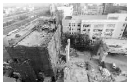
南广场附近的一幢7层楼房月底将拆除完毕

春运临近,南京站南北广场不通的问题,再次困扰着乘客。昨天,现代快报记者从世纪东路上跨铁路立交工程项目部获悉,连接南北广场的世纪东路有了突破性建设进展,最快在2015年年底建成。