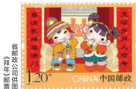
《拜年》邮票

快报讯(实习生 张敏 记者 赵丹丹)现代快报记者从江苏省邮政公司获悉,明天,中国邮政将发行《拜年》特种邮票1套1枚。