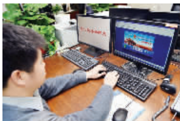
工作人员登录系统阅读网络举报件