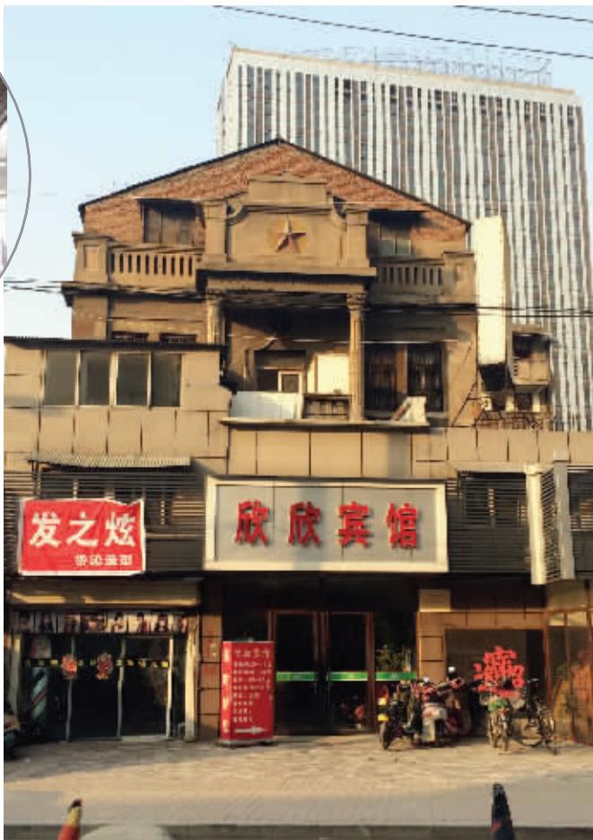
这座民国建筑将北移