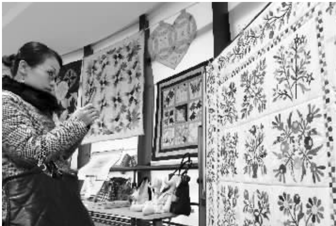
创博会组委会展示了部分手工拼布作品

此次“国际手工拼布艺术展”将展出世界各地上百幅优秀拼布作品,现场展示巧夺天工的拼布技法;邀请美国、德国、荷兰、加拿大等国的拼布专家现场演示缝纫机创意使用方式,以及拼布和不同材料的结合运用;现场还会有200台缝纫设备邀请参观者一同体验;一次性展示5000种拼布工具的设计和使用……配合此次拼布展,创博会组委会还将首次举办独立家用缝纫机展,届时会有6大类、80款机器展示国际高科技缝纫机创意玩法。