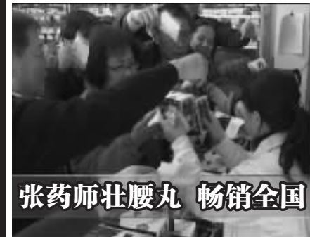
张药师壮腰丸 畅销全国