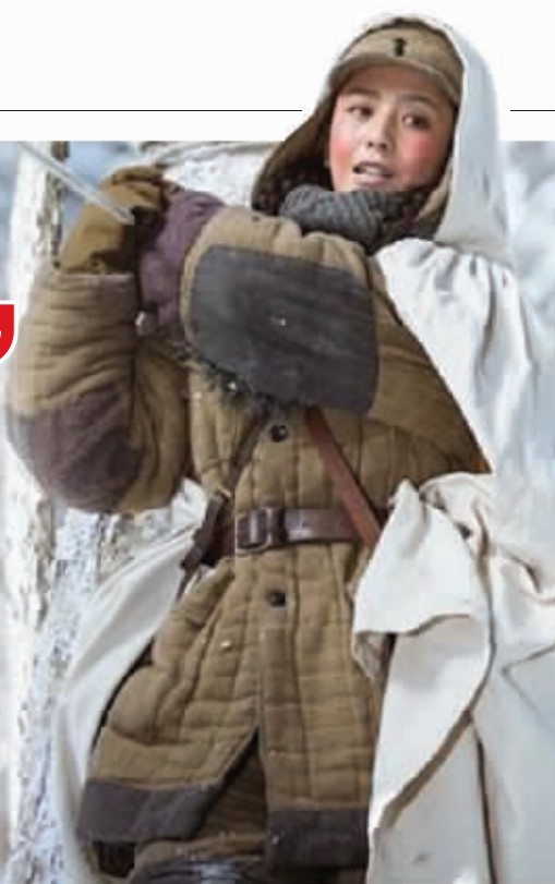
佟丽娅饰演小白鸽