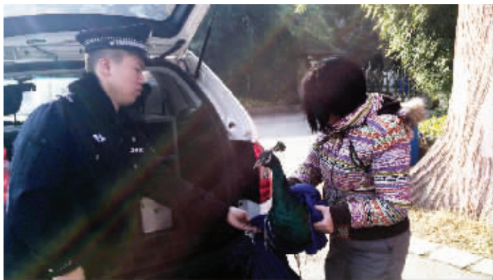
民警将“救”下的孔雀送往动物园安置

民警查看了附近地形后,爬上院子的房顶去抓孔雀。可不知是孔雀对这里的地形太熟悉,还是身体太灵活,只要民警一靠近,它就逃跑。三位民警只得不时调整包围圈,对孔雀进行“围捕”。就这样,双方整整较量了一个小时,民警才终