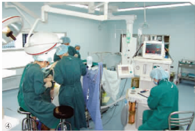
④ 四级垂直层流手术室