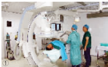
① 数字减影血管造影机(DSA)