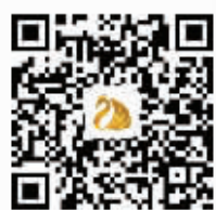
美容科微信二维码

医疗美容科、整形外科为南京市妇幼保健院一级科室,是江苏省公立三甲医院中规模最大、实力最强的整形美容专业科室之一。