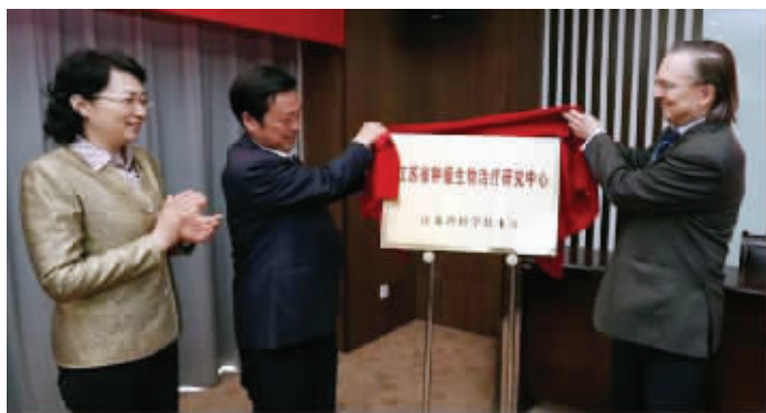
江苏省肿瘤生物治疗研究中心成立,诺奖获得者受聘为中心学术顾问

“通常人们闻‘瘤’色变,过去有些医生也逢瘤必割,其实,这不是最佳的方式”。该院在全国率先提出“没有明确病理诊断的肿块,不能做毁损性治疗(除手术外,包括放疗、化疗)”的原则。目前,这个倡议已被国家卫计委列为肿瘤专科评审项目之一。该院坚持既要为