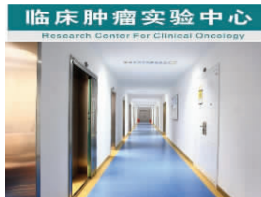
临床肿瘤实验中心

人文关怀,是广大医护人员一以贯之的自觉行动。恶性肿瘤患者是个特殊群体,不能仅仅满足于治疗他们身体上的疾病,还要关注他们的心理、精神健康。肿瘤病人患病后往往会背上沉重的心理负担,为帮助他们建立积极健康的心态,医院成立了乳腺癌、淋巴瘤、造口人士之家等多个关爱之家,与南京市癌友协会建立了良好的沟通,癌友与专家、护士、病友零距离交流,同台演出;组织抗癌明星看望新病友,为新病友进入癌友协会搭建桥梁,通过各种活动使肿瘤病友走出心理阴影,科学防癌抗癌,养成积极乐观的心态,回归正常生活。拉近了医患、患患之间的距离。医院连续多年被评为“百姓信赖的医院”、“315诚信服务满意单位”等称号。