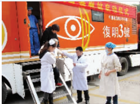
南医大二附院眼科组队参加全省百万贫困白内障患者复明工程行动