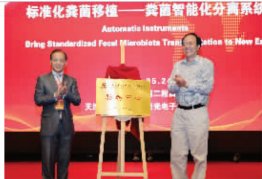
南医大二附院举办“2014肠病与粪菌移植学术会议”