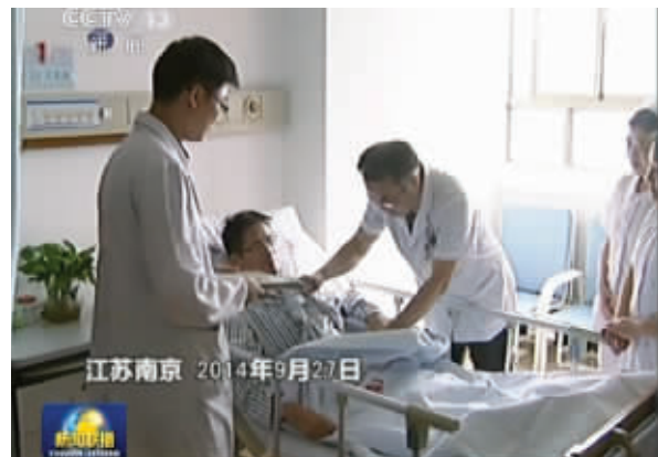
中央电视台采访南医大二附院新型农村合作医疗异地联网即时报工作

外科在内床位200张,每年总住院人数10000余名,并根据患儿的需求增加诊室,每天都安排有高级专家门诊,周六周日也不例外,即便是小儿皮肤科、小儿耳鼻喉科这样的专科周末也同样开诊,17:00—21:00还特别开设了特需专家门诊,方便上班族下班后带孩子来就诊。同时还开通了24小时新生儿抢救绿色通道,新生儿专用救护车和专业人员可在最短的时间内上门迎接新生患儿。