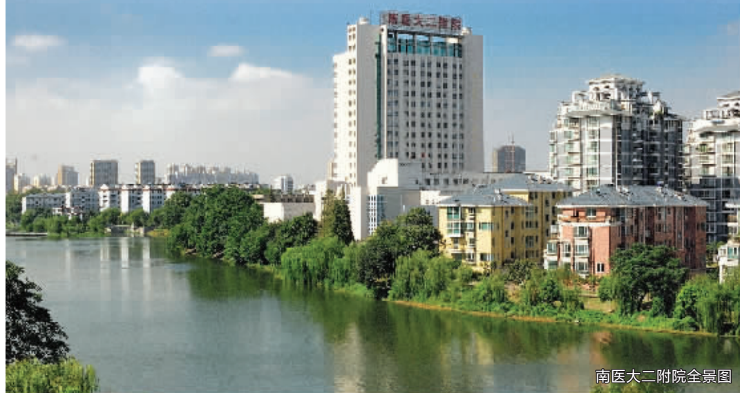
南医大二附院全景图

虽然南医大二附院在主动适应医改方面做了一定的探索,但对照上级主管部门的要求和其他兄弟医院还存在着明显的差距,还需继续努力,不断进取。党的十八大为新医改指明了前进方向,我们要努力把党的十八大精神转化为做好当前工作、推动医疗卫生事业改革发展的具体思路 and 实际行动。继续坚持以人为本、创新发展和服务的理念,多管齐下、改进服务,真正做到“服务病人、满意病人、感动病人”,只有这样,医院发展才会永远保有强大的内驱力。