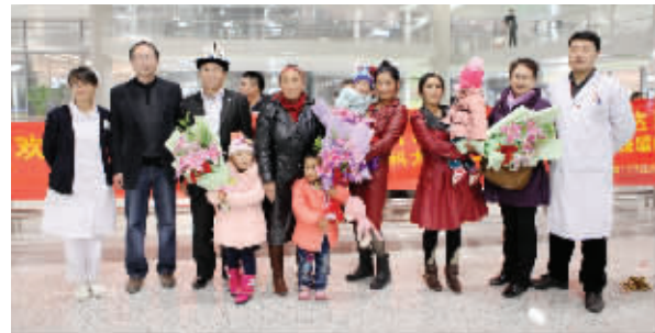
南医大二附院心血管外科积极参与“心佑工程”,免费救治新疆先心病患儿