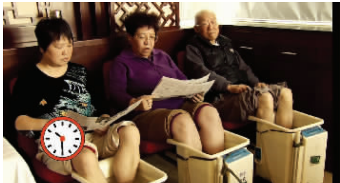
三名志愿者进行泡脚测试

随着冬季天气越来越冷,人们为了保暖防寒,采取了各种办法。民间一直流传着一种说法:“热水泡脚,赛吃人参。”奔波一天后,在临睡前用热水泡脚,洗去一天的疲惫,对于多数人来说,是个不错的享受。特别是冬天气温下降,用热水泡脚几乎成了很多人的一个习惯。但近日,网上一则传言称,热水泡脚会导致人猝死,这是真的吗?