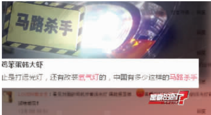
央视进行氙气灯有关调查

开车人滥用远光灯的问题一直被网友诟病,由于乱用远光灯而引发的车祸常有发生。但就在大家纷纷吐槽“曾被远光灯晃眼”的愤怒时,有网友提出,更大的杀手其实是私自改装的氙气灯。在一个汽车论坛的投票调查中,有63%的人都表示曾经有过被氙气灯照得炫目的经历。