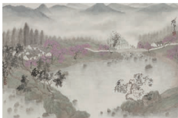
孙洪《楚水含影之三》