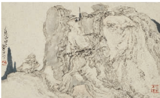
朱道平《天柱石奇泉幽》