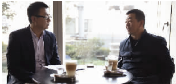
顾导与快报记者相谈甚欢

顾长卫: 在我的家庭里, 我是50后, 但是我的孩子都是2000后, 我不希望和孩子们有代沟, 所以他们玩什么我玩什么, 他们知道的我也很有兴趣了解。不管你是80、70后还是50、60后, 我们其实都共同地在经历2000后、10后, 这其中的巨变是爆炸式的, 有很骨感很纠结的一面, 但是也有很多让人兴奋的疯狂的立体的东西。在这之中, 无论你拒绝与否, 宅或不宅, 你都无法回避这些现实。你看现在很多人的微博微信都是在床上收发的, 你跟这个世界的关联是无处可躲的。每个人都可能是文艺青年, 在这个大的环境下, 我更觉得每个人都应该有态度。