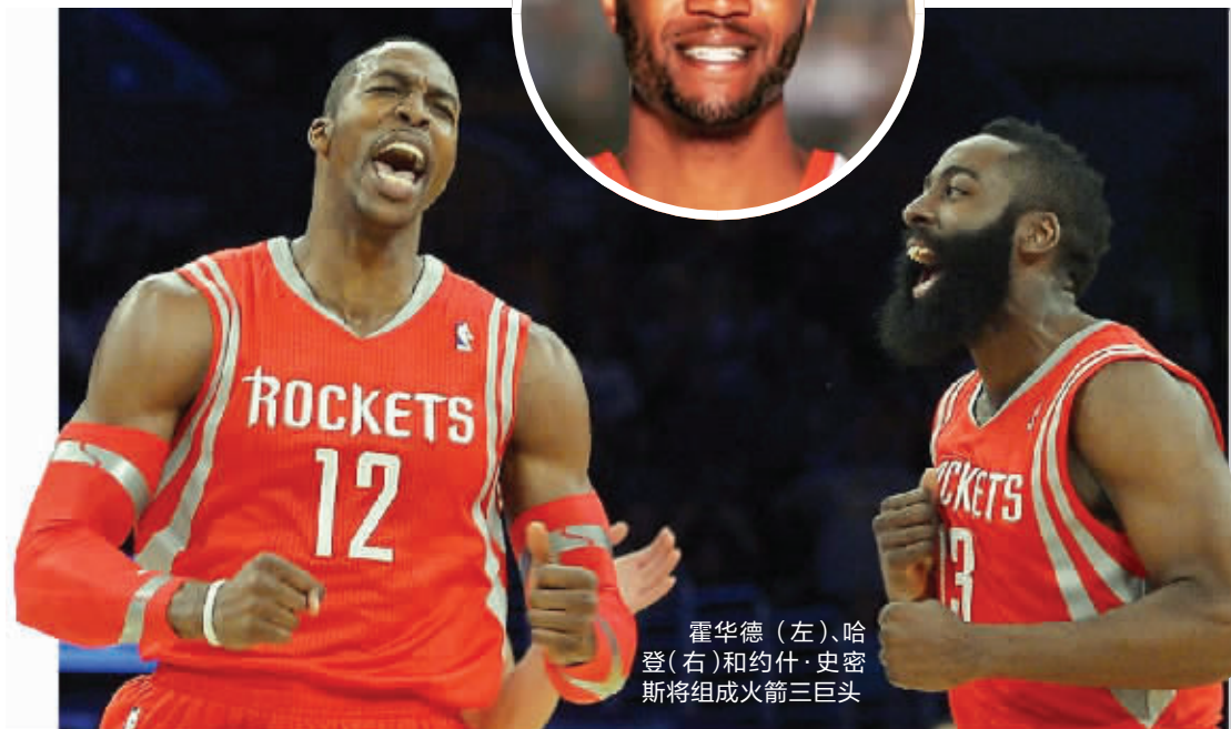
霍华德(左)、哈登(右)和约什·史密斯将组成火箭三巨头

昨天,据雅虎体育记者亚德里安·沃纳洛夫斯基爆料,“扣篮王”约什·史密斯已经决定加盟火箭,火箭版三巨头呼之欲出。