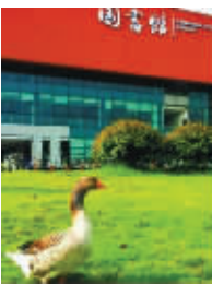
重大学霸雁就是在下

2013年4月,一只大雁跑到重大虎溪校区图书馆门口“溜达”了一圈,被网友拍下,称其为“学霸”,并呼吁大学生也好好学习。