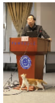
院士大牛,我是专程来中科大膜拜你哒

大黄是一只狸花猫,每当日落西山之时便躺在教育超市门口,等待着购买食物的同学们的“供奉”,偶尔还会赏脸卖个萌。 大黄曾被发现与多名异性猫咪发生了不正当关系,据说差点就被拖走做绝育手术。