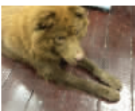
湖大复临汪德高望重

狗狗的英文名叫Flingo,中文名叫咖啡,生活在湖南南校区复临舍教学楼的车库。由于德高望重,很多同学敬它一声“董董事长”。 这位“董董事长”有一个很厉害的技能,那就是上厕所会去隔间,还知道随爪关门。