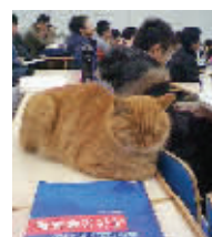
作为北大学术猫,看懂《现代光学基础》完全不在话下

2013年11月12日,一只黄白相间的猫迈着淡定的猫步走进了中国科学技术大学的一个会场。只见它站在门旁静静听了一会儿院士的报告,接着走到报告台前,成功吸睛。不到一天,“学术猫”就火了。 北大有一只断尾的老猫,时而蹿到讲台上作老师状,时而趴在课桌上装认真“听课”的学生。北大电教、理教和一教都是其活动范围。 此猫会和人长时间地对视,沧桑古意映入人的眼帘,不知它怀着怎样的心事。