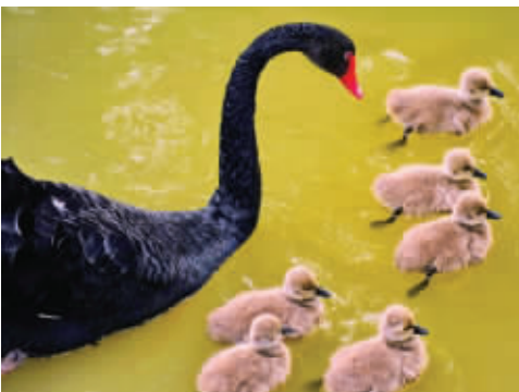
中南大学高贵冷艳的黑天鹅

今年5月份,中南大学新校区天鹅岛上的6只刚出生的黑天鹅宝宝在自然环境下全部成功孵化。岛上的24只天鹅,有20只都是自然繁衍的。