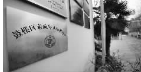
这所学校也是鼓楼区未成年人保护中心