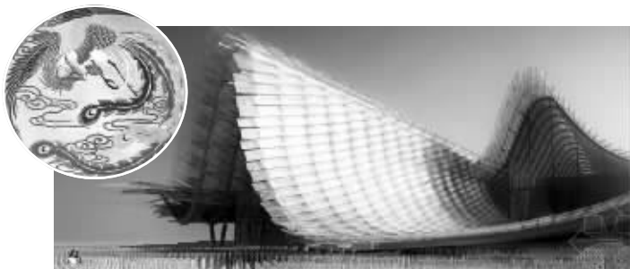
小图:南京云锦 大图:米兰世博会中国馆效果图 资料图片