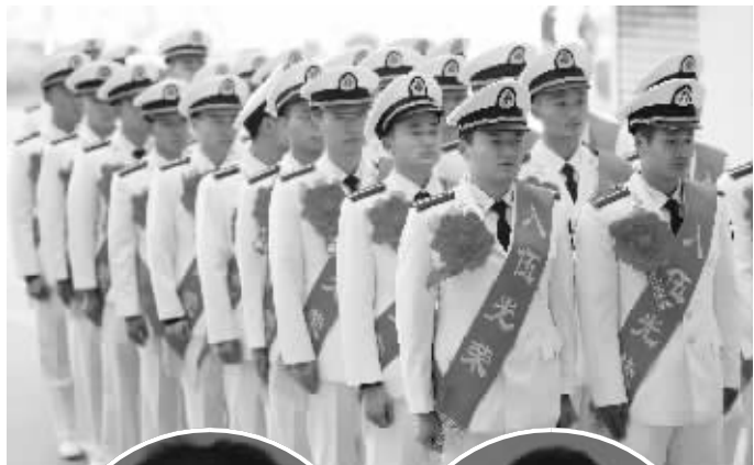
江苏海事学院的首批船舶士官学员