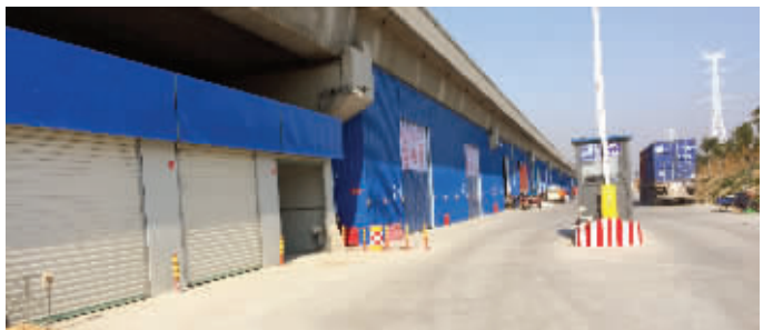
高速公路桥洞被违规建成了十几间仓库

常州市凌家塘农副产品批发市场西边的S39江宜高速公路(常州西绕城段)下,有人用彩钢瓦将一排桥洞改建成了仓库,并用于出租做起了物流生意。现代快报记者调查发现,这排仓库并未办理任何手续,而且根据相关法律法规高速公路桥下是严禁搭建房屋或仓库的,目前相关部门已立案调查。 陆文杰 文/摄