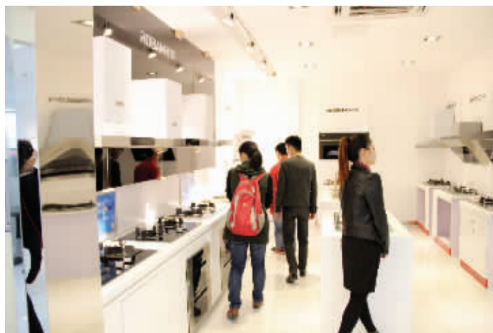
本版配图均为生活家装饰体验馆内实拍图

近期，生活家装饰总部向全国12个城市的家装业主推出“水电包全赠送”优惠，作为集团“为爱出发，狂欢4周年盛典”的总部特批活动。只要拨打电话预约，就有机会享受全屋免费“水电改造”或全屋软装，仅限40名。 现代快报记者 张彦怡