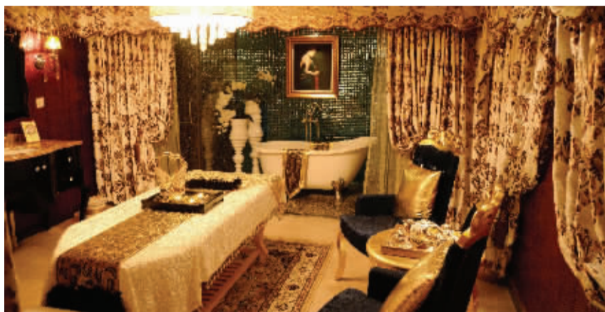
泰秘的头等舱包间

要想成为丰韵女神,没有性感的身材、挺拔的胸部怎么行?毋庸置疑,胸部是最能展现女性魅力的所在,也是女性最需要养护的部位。怎么才能知道自己的胸部是否健康?什么样的美胸养胸方式最安全?在泰秘·丽人会,一切皆有答案。 现代快报记者 王苏颖