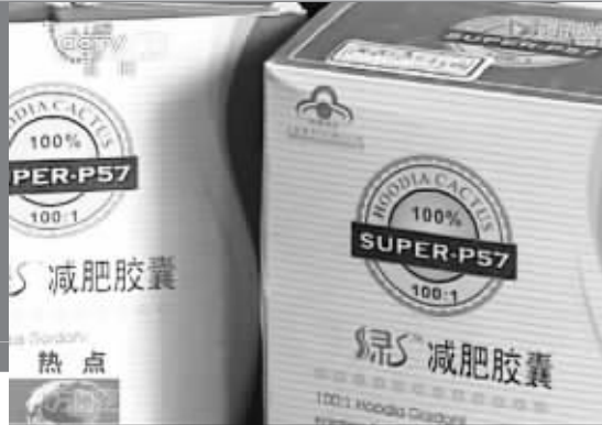
“绿S减肥胶囊”的原料是网购的,含有西药成分,包装之后以“纯天然”的名义在淘宝网上销售