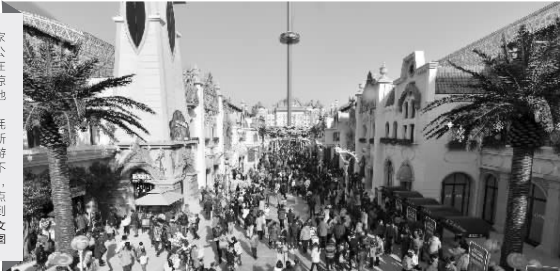
迪诺水镇开放,人气爆棚

当晚,由龙控集团耗资2000万元打造的迎新灯会也同时向市民和游客开放。这个主题灯会不仅是常州地区规模最大,而且全程免费,每晚五点半准时亮灯,一直持续到明年3月8日。张敏/文