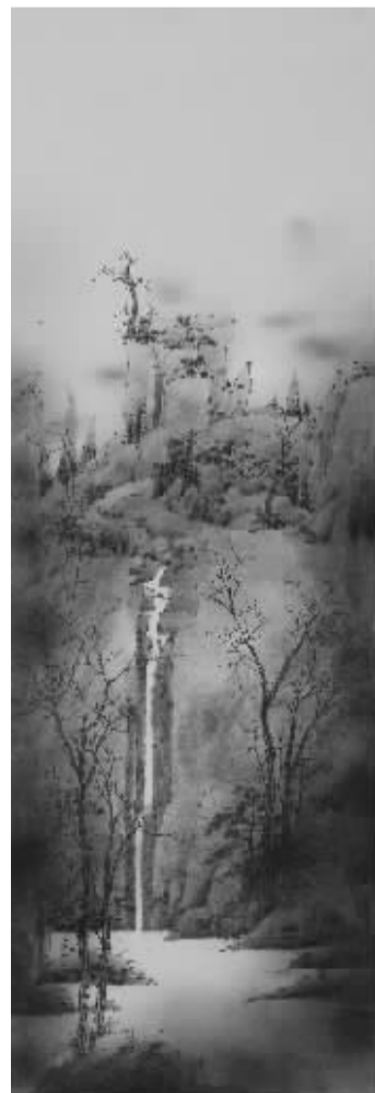
《旧日 21》100cm × 34cm