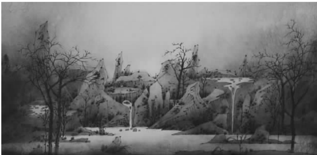
《旧日》34cm × 68cm