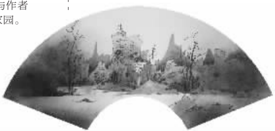
《旧日扇面6》60cm × 22cm

作为重新杀入艺术圈的诸多相似者中的一员,林彬的生活与艺术注定是孤然的。他是一个生命归程中不安分的行者,如此折腾,只是为拥有一个属于自己的如歌人生。