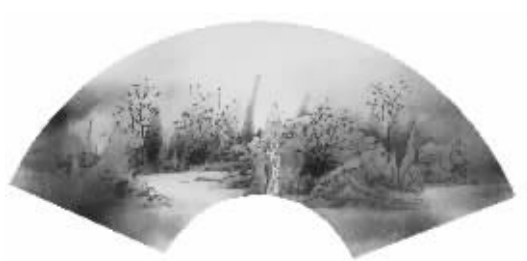
《旧日扇面2》60cm × 22cm