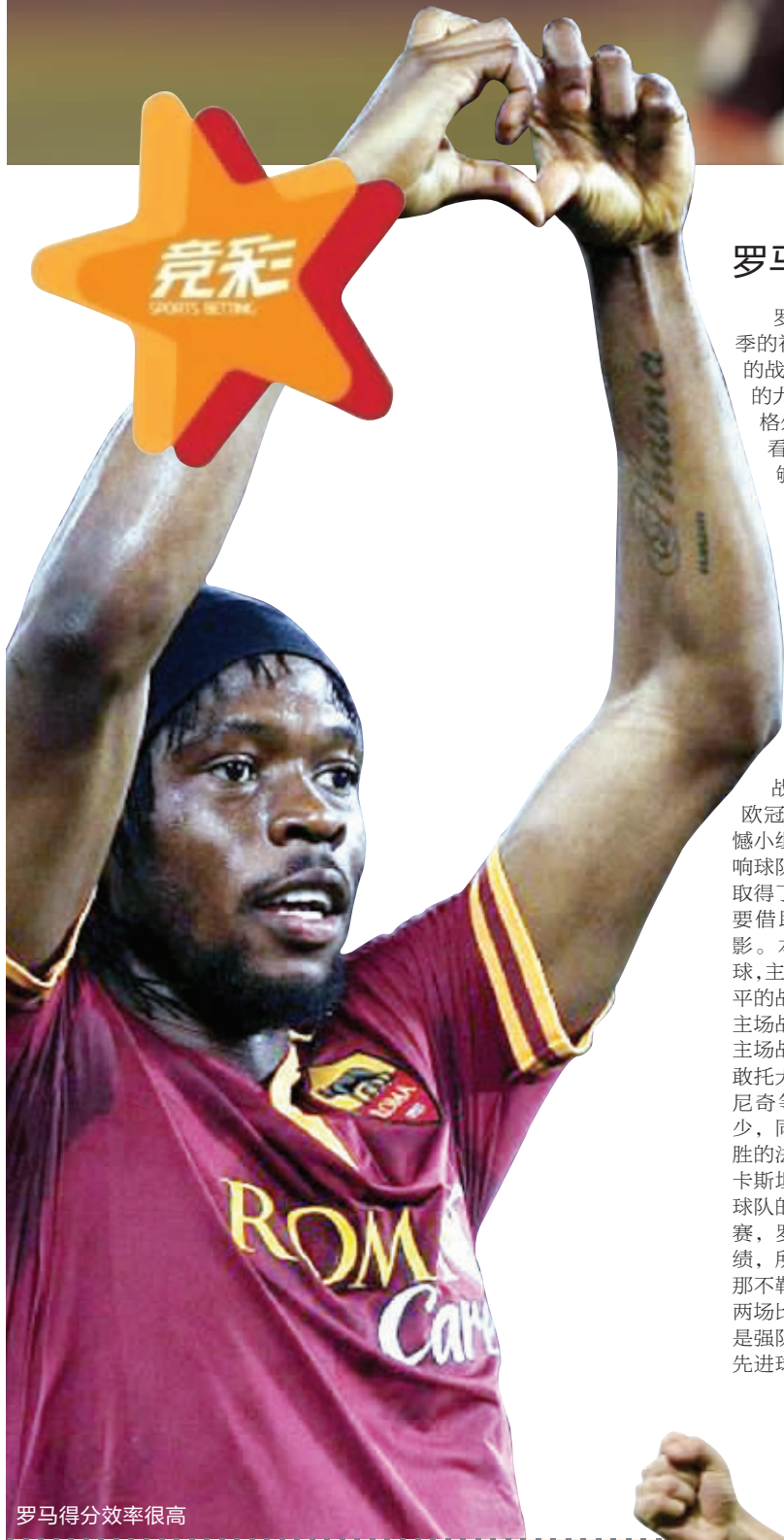
罗马得分效率很高