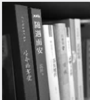
女儿房间的书架上放满了书