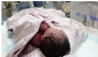
男婴还在医院治疗

12月17日晚,溧阳人民医院团委官方微博上一条关于“弃婴”的消息,引发众多网友关注。