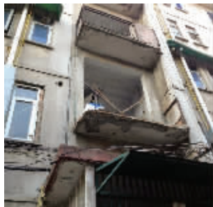
发生坠楼事故的楼房,二楼栏杆和部分楼板已经脱落