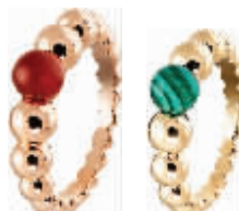
Van Cleef & Arpels梵克雅宝 Perl é e系列Perl é e Couleurs戒指