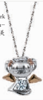
Forevermark 周大福 Forevermark永恒印记Lucky Angel福星宝宝系列美钻吊坠