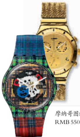
Swatch 金色封面 RMB 1560

Rendez-Vous Ivy Minute Repeater约会系列常春藤三问腕表搭载了两枚专利“trébuchet”天秤锤，令其报时乐音和谐悦耳、动人心弦，其旋律更为亲切、醇厚和甜蜜，洋溢着浓郁的女性温婉气质。