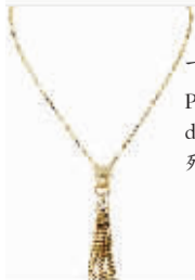
卡地亚 Panthère de Cartier系列项链