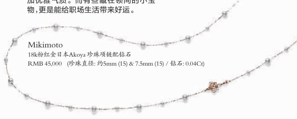
Mikimoto 18k粉红金日本Akoya珍珠项链配钻石 RMB 45,000 (珍珠直径: 约5mm (15) & 7.5mm (15) / 钻石: 0.04Ct)