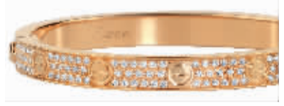
卡地亚Love系列手镯 RMB 328,000

中国独家发售的蓝气球系列对表，以圆润表盘象征这一年的圆圆满满，以饱满色泽勾勒又一年的缤纷美好。 Ballon Bleu de Cartier卡地亚蓝气球腕表