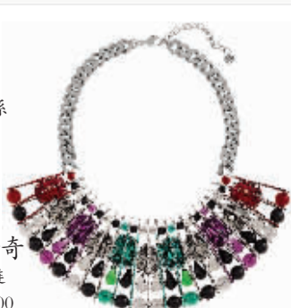
施华洛世奇 Blossom项链 RMB 6,600.00