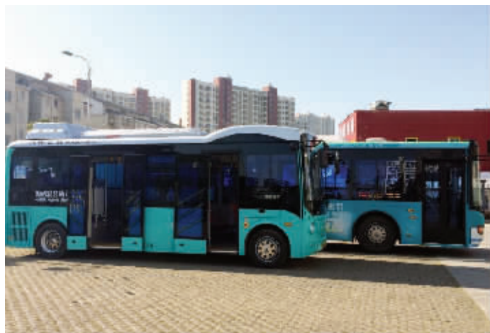
比起普通公交,微型公交更迷你