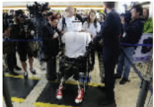
12月15日,美国洛杉矶国际机场,仿人机器人雅典娜脚蹬红色帆布鞋,时髦登场