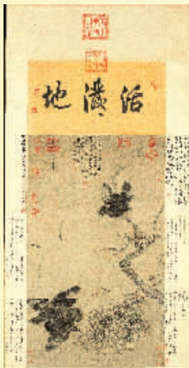
宋徽宗《鸚鵡图》

南博作为主场,捧出的作品也最多,绝大多数都是首次亮相。其中,最受关注的是宋徽宗的《鸚鵡图》。“鸚鵡,俗名八哥。《鸚鵡图》中三只八哥,两只正在激烈相斗,一只在一旁观战。这幅画乾隆年间收入清宫,后经嘉庆、咸丰内府收藏,光绪年间流出清宫,曾经南海画楼、玉峰周氏收藏,后归庞莱臣珍藏。”庞鸥介绍说,日军侵华时期,日本人也相中了这幅画,庞莱臣找来画师临摹了一幅给了对方,将真迹留下。据介绍,《鸚鵡图》也是江苏收藏的唯一一幅宋徽宗真迹,上面还有乾隆皇帝的亲笔御题“活泼地”,并有咸丰帝和乾隆韵一首。